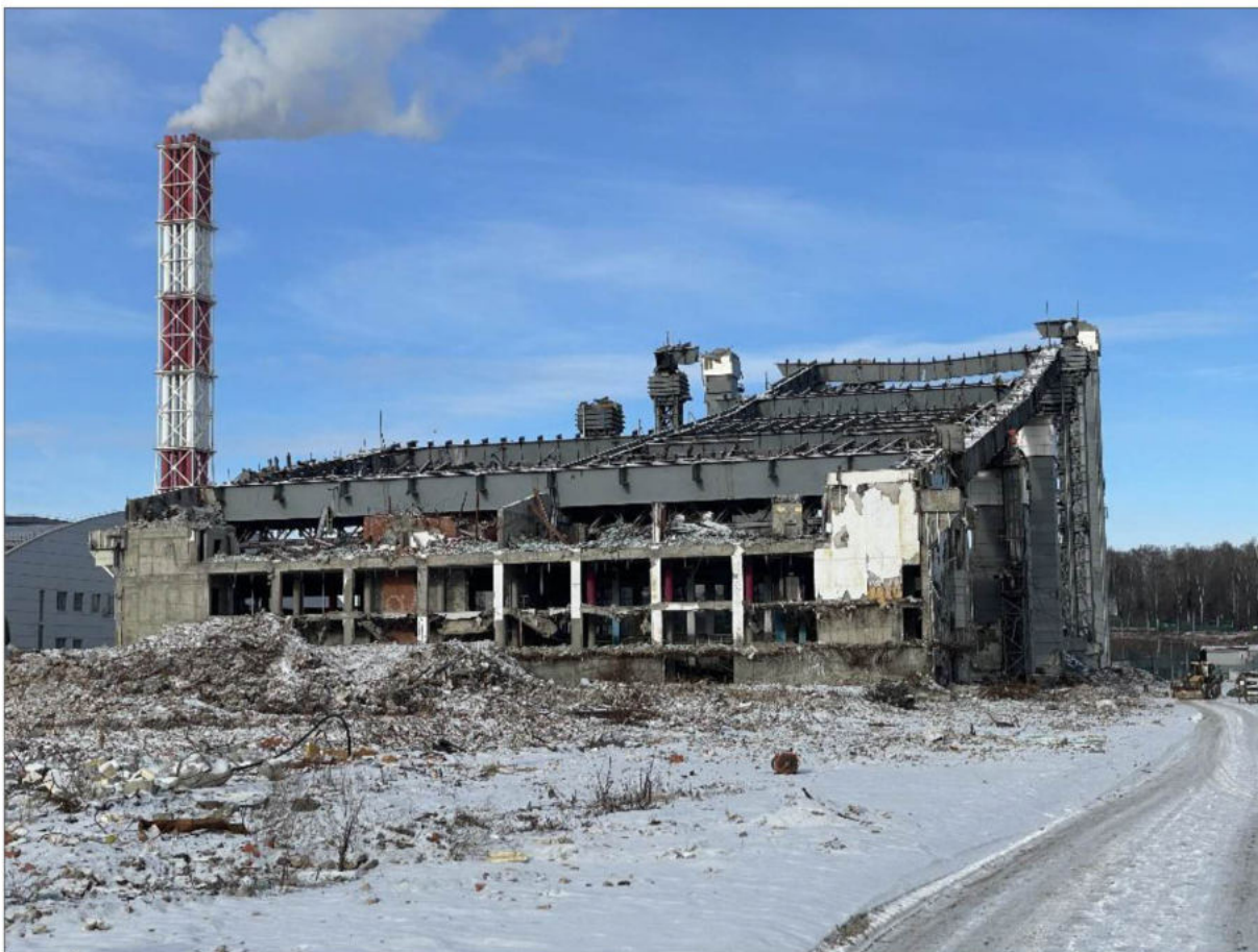
Фото 1. Общий вид Объекта в осях «А-Н/29-34».